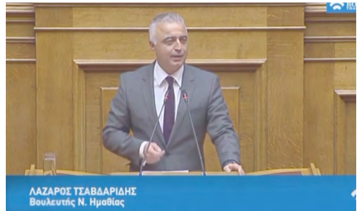
ΛΑΖΑΡΟΣ ΤΣΑΒΔΑΡΙΔΗΣ Βουλευτής Ν. Ημαθίας

Όσον δε αφορά στον Προϋπολογισμό του 2020, ο Βουλευτής Ημαθίας τόνισε ότι η ΝΔ διασφαλίζει και μεγεθύνει ακόμη περισσότερο τις προοπτικές δύο κομβικών αξόνων της πολιτικής της.