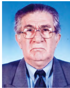
Γράφει ο Παναγιώτης Παπαδόπουλος, φιλόλογος

«Να αγαπάς την πατρίδα και όταν είναι άδικη» Πλάτων