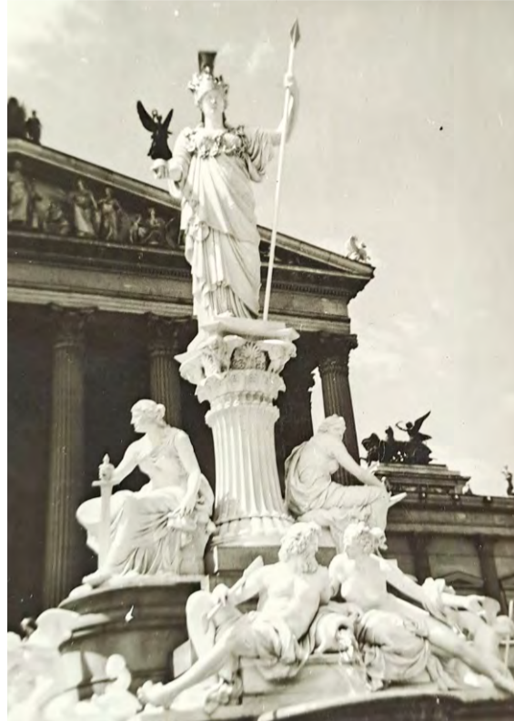
Αγάλματα θεών μπροστά στο Κοινοβούλιο της Βιέννης

Ιδρύθηκε από τον Θηβαίο περίφημο στρατηγό Επαμει-