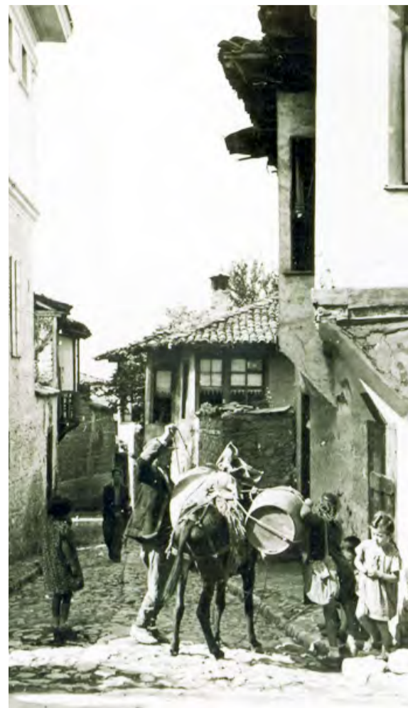
Οδός Σοφού, με το καλνερίμι του και τα στίπια που εκείνα τα χρόνια είχαν ζωή.