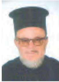
Του ιερέως Παναγιώτου Σ. Χαλκιά

Ο Λόρεντζ Κόνρατ, φίλοι αναγνώστες, που πήρε το βραβείο Νόμπελ για την ιατρική το 1973, στο βιβλίο του «Τα 8 θανάσιμα αμαρτήματα του πολιτισμού μας», αναφέρει οκτώ φαινόμενα των καιρών μας, που απειλούν τον αφανισμό του ανθρώπου.