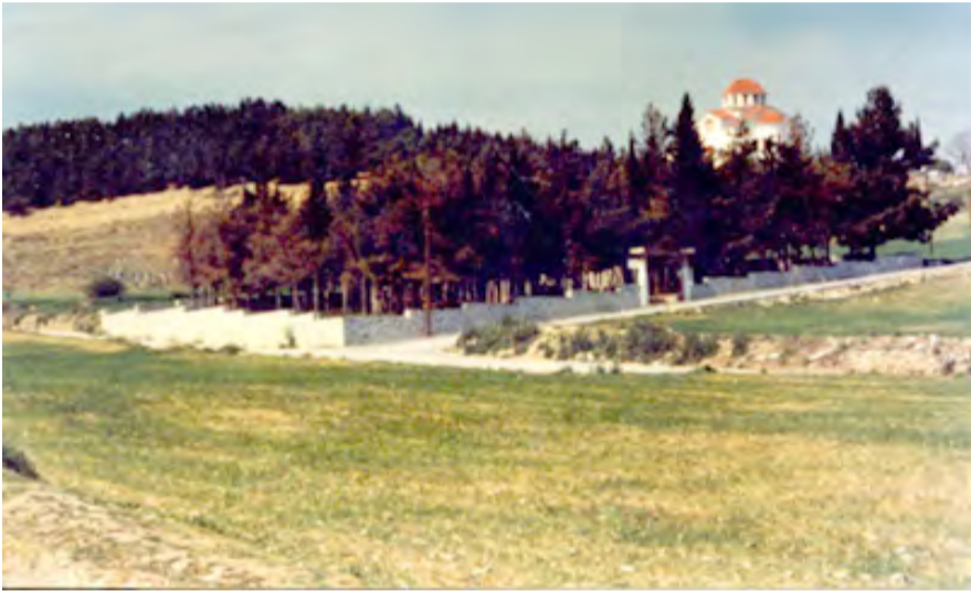
Η περιοχή «Σπίτι του Ρήγα» βρίσκεται έξω από τον οικιστικό ιστό του σημερινού Βελεστίνο.

2). Θέλουμε να επισημάνουμε πως σε όλα τα έργα του ο Ρήγας αναγράφει το όνομα και την καταγωγή του, όπως για παράδειγμα «Φυσικής απάνθισμα...παρά Ρήγα Βελεστινλή Θεσσαλού». Δηλώνει τον τόπο της καταγωγής του και την ευρύτερη περιοχή, την Θεσσαλία και όχι την Μακεδονία, όπως άλλοι λόγιοι, που κατάγονταν από την Μακεδονία, «Θωμάς Μανδακάσης Κατοριανός Μακεδών, Δημήτριος Καρακάσης Σιαπιστεύς Μακεδών».