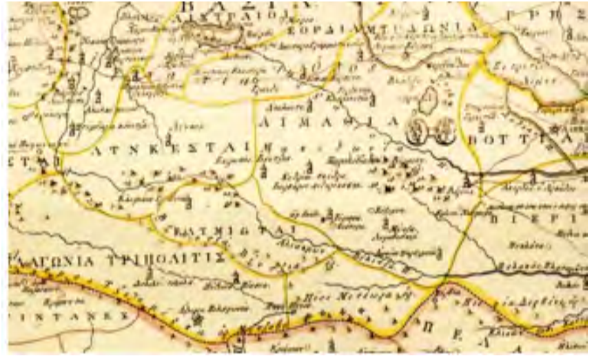
Η περιοχή των Γρεβενών της Χάρτας του Ρήγα Βελεστινλή, Βιέννη 1797, όπου απουσιάζουν τα Βλαχοχώρια, Περιβόλι, Σαμαρίνα, Αβδέλλα. Αν ο Ρήγας τα γνώριζε θα τα ανέγραφε, όπως τόσα έχει γράψει για την Μαγνησία και την Θεσσαλία, που τα γνώριζε.

3). Επί πλέον, ο Ρήγας στα έργα του αναγράφει πολλά στοιχεία για το Βελεστίνο και την ευρύτερη περιοχή του, τη Μαγνησία και τη Θεσσαλία, ενώ τίποτε δεν γράφει για τα Βλαχοχώρια, κάτι που θα έκανε αν τα γνώριζε, (βλ. Δημ. Καραμπερόπουλου, «Το Βελεστίνο και η Θεσσαλία στο έργο του Ρήγα Βελεστινλή», Υπέρεια, τόμ. 3, Πρακτικά Γ' Διεθνούς Συνεδρίου «Φεραί-Βελεστίνο-Ρήγας», Αθήνα 2002, σελ. 713-738).