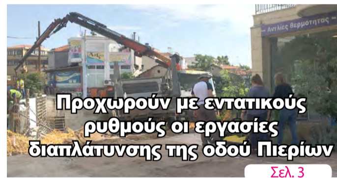
Προχωρούν με εντατικούς ρυθμούς οι εργασίες διαπλάτυνσης της οδού Πιερίων