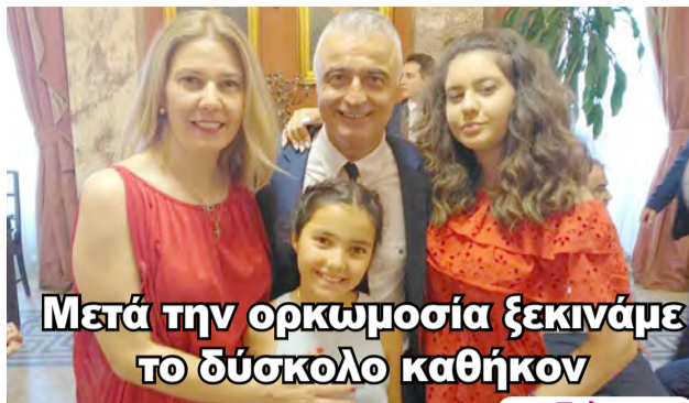
Μετά την ορκωμοσία ξεκινάμε το δύσκολο καθήκον