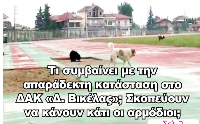
Τι συμβαίνει με την απαράδεκτη κατάσταση στο ΔΑΚ «Δ. Βικέλας»; Σκοπεύουν να κάνουν κάτι οι αρμόδιοι;