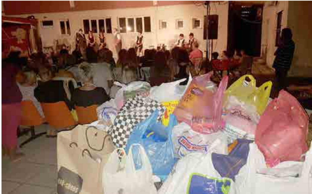
Το ΔΗΠΕΘΕ Βέροιας ανακοινώνει:

«Μετά από τη μεγάλη επιτυχία της παραγωγής του ΔΗ.ΠΕ.ΘΕ Βέροιας «Εις τους πέντε δρόμους!» το Καλοκαίρι 2017, η παράσταση έκανε περιοδεία και το Καλοκαίρι 2018, στις γειτονιές της Βέροιας και σε Τοπικές Κοινότητες του Δήμου με την παράσταση «Εις τους πέντε δρόμους» της Λένας Πετροπούλου και στις 13 Σεπτεμβρίου