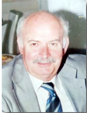
Του Μάκη Δημητράκη

Ο Όσιος Θεοφάνης ήταν Γιαννιώτης στην καταγωγή και έζησε πιθανότατα τον 16ο αιώνα. Γεννήθηκε πιθανόν μεταξύ των ετών 1520-1530 και νέος έφυγε από τα Γιάννενα και πήγε στο Άγιο Όρος και έγινε μοναχός και ακολούθως χειροτονήθηκε διάκονος, ιερέας και τέλος ηγούμενος στη Μονή Δοχειαρίου. Από εκεί έφυγε και πήγε στην Κωνσταντινούπολη όπου έμαχνε για τον ανεψιό του ο οποίος «θύμα του παιδομαζώματος» βρέ-