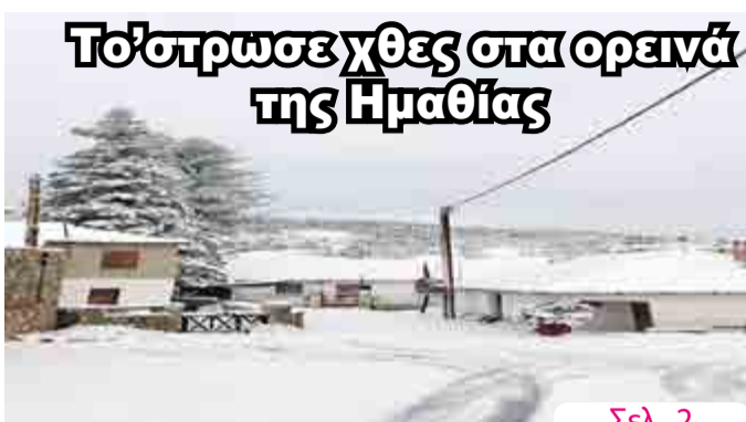
Το έστρωσε χθες στα ορεινά της Ημαθίας