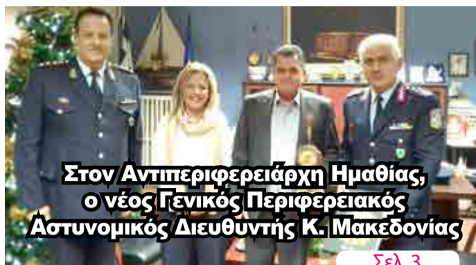
Στον Αντιπεριφερειάρχη Ημαθίας, ο νέος Γενικός Περιφερειακός Αστυνομικός Διευθυντής Κ. Μακεδονίας