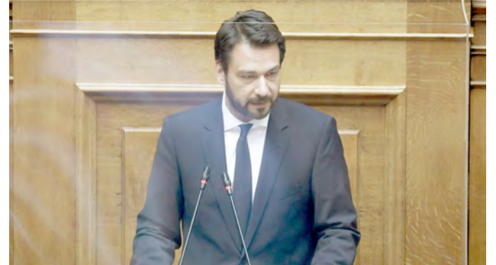
τητα του ότι οι αλλαγές στο αθλητικό τοπίο θα αποδώσουν πολλούς και καλούς καρπούς.