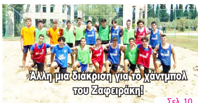
Άλλη μια διάκριση για το χάντμπολ του Ζαφειράκη!