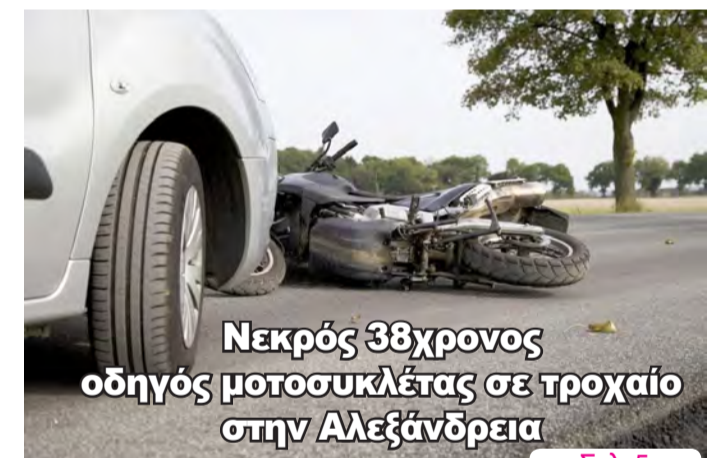
Νεκρός 38χρονος οδηγός μοτοσυκλέτας σε τροχαίο στην Αλεξάνδρεια