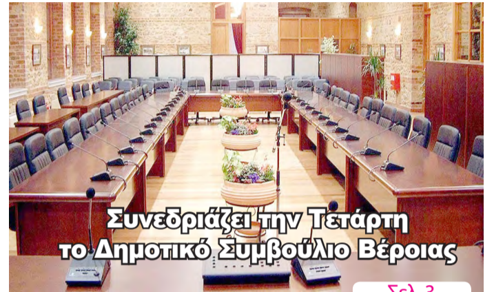
Συνεδριάζει την Τετάρτη το Δημοτικό Συμβούλιο Βέροιας

ΑΔΕΣΜΕΥΤΗ ΚΑΘΗΜΕΡΙΝΗ ΕΦΗΜΕΡΙΔΑ ΤΟΥ ΝΟΜΟΥ ΗΜΑΘΙΑΣ