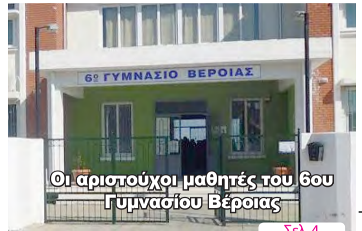
Οι αριστούχοι μαθητές του 6ου Γυμνασίου Βέροιας