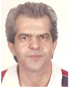
Του Πάρη Παπακανάκη

«Το ένα φέρνει τ' άλλο», όπως με σοφία λέει ο λαός μας... και καθώς είναι ακόμη ευαισθητοποιημένες οι αισθήσεις μας απ' τον απόηχο των ημερών, ο λόγος σήμερα για την «πλατεία Πλατάνων».