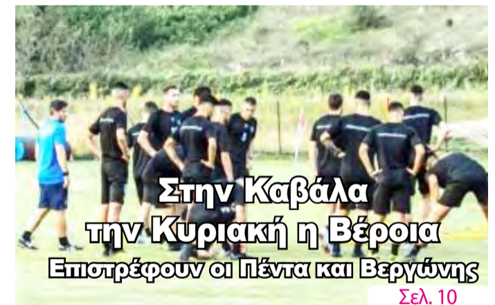
Στην Καβάλα την Κυριακή η Βέροια Επιστρέφουν οι Πέντα και Βεργώνης