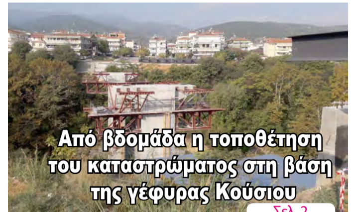
Από βδομάδα η τοποθέτηση του καταστρώματος στη βάση της γέφυρας Κούσιου

ΑΔΕΣΜΕΥΤΗ ΚΑΘΗΜΕΡΙΝΗ ΕΦΗΜΕΡΙΔΑ ΤΟΥ ΝΟΜΟΥ ΗΜΑΘΙΑΣ