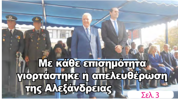
Με κάθε επισημότητα γιορτάστηκε η απελευθέρωση της Αλεξάνδρειας