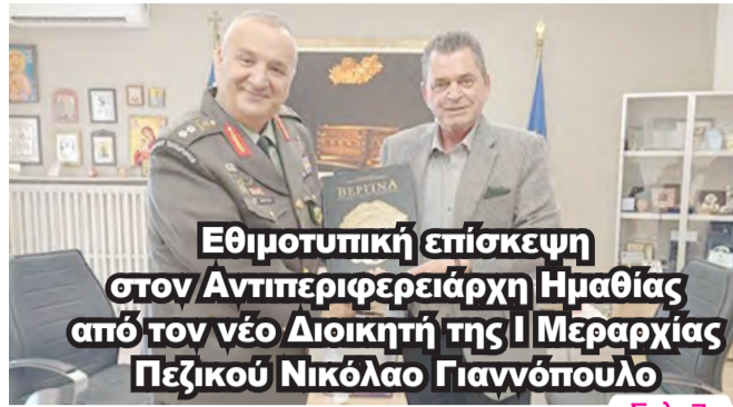
Εθιμοτυπική επίσκεψη στον Αντιπεριφερειάρχη Ημαθίας από τον νέο Διοικητή της Ι Μέραρχίας Πεζικού Νικόλαο Γιαννόπουλο