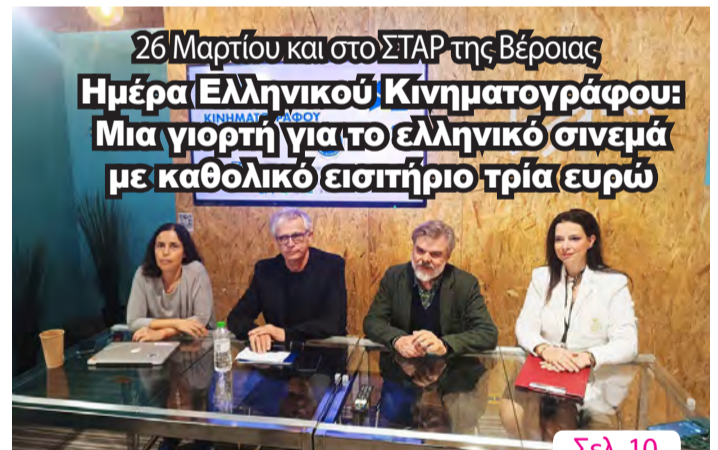
26 Μαρτίου και στο ΣΤΑΡ της Βέροιας Ημέρα Ελληνικού Κινηματογράφου: Μια γιορτή για το ελληνικό σινεμά με καθολικό εισιτήριο τρία ευρώ