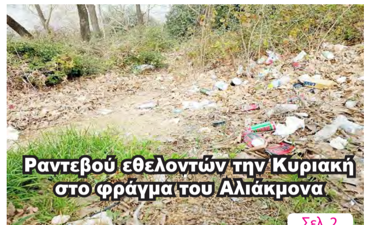
Ραντεβού εθελοντών την Κυριακή στο φράγμα του Αλιάκμονα

Θα λειτουργεί ως "φορολογικό ξυπνητήρι" για πολίτες και επιχειρήσεις