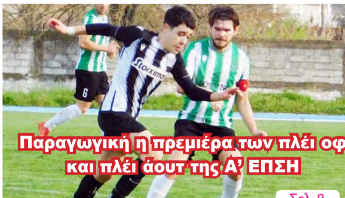
Παραγωγική η προεπιμέλεια των πλέι οφ και πλέι άουτ της Α' ΕΠΣΗ