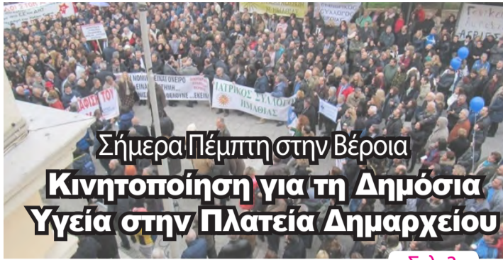
Σήμερα Πέμπτη στην Βέροια Κινητοποίηση για τη Δημόσια Υγεία στην Πλατεία Δημαρχείου