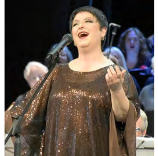
- Μικτή χορωδία της Σαμοθράκης - Μαθητικές Χορωδίες από τα Ελληνικά Σχολεία της Κωνσταντινούπολης: Ζωγράφειο - Μεγάλη του Γένους Σχολή - Ζάππειο