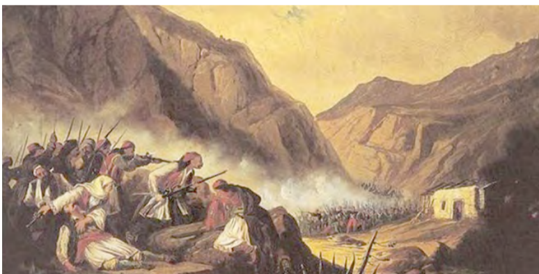
Ο Θεόδωρος Κολοκοτρώνης στα Δερβενάκια

Σε λίγες μέρες ο στρατηγός Χουρσίτ κάλεσε το στρατό τους Τούρκους προύχοντες και το ιερατείο στο Τζαμί της Λάρισας χωρίς να δώσει εξηγήσεις. Όταν έφτασαν όλοι και πήραν τη θέση τους, ο Χουρσίτ πα-