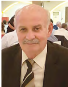
Επιμέλεια: Μάκης Δημητράκης

και η «συγκατοίκηση» με την Αγία Παρασκευή