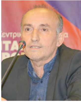
Του Βασίλη Κωνσταντινόπουλου

Στις τελευταίες δημοσκοπήσεις, όλων των εταιρειών το μεγαλύτερο πρόβλημα της Ελληνικής κοινωνίας δεν είναι η πανδημία που ακόμη την ταλανίζει, αλλά η «εξοντωτική» ακρίβεια. Ειδικά στο ηλεκτρικό ρεύμα οι λογαριασμοί έρχονται το λιγότερο με 50% αύξηση και στις περισσότερες περιπτώσεις διπλάσιοι, και τριπλάσιοι. Καθημερινά κατακλύζουν τον έντυπο και ηλεκτρονικό τύπο, ειδήσεις με ανθρώπους που βλέποντας τον λογαριασμό της ΔΕΗ και των άλλων εταιρειών, τους συμβαίνουν πρωτόγνωρες καταστάσεις, αφού οι άνθρωποι κινδυνεύουν να πάθουν καρδιακή προσβολή ή εγκεφαλικό και χρειάζονται ηρεμιστικό για να μπορέσουν να γλυτώσουν τα χειρότερα. Στην Ρόδο μια κάτοικος ξεκίνησε απεργία πείνας έξω από το υποκατάστημα της ΔΕΗ, όταν της ήρθε 3.821 ευρώ ο λογαριασμός ηλεκτρικού ρεύματος.