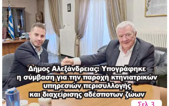
Δήμος Αλεξάνδρειας: Υπογράφηκε η σύμβαση για την παροχή κτηνιατρικών υπηρεσιών περισυλλογής και διαχείρισης αδέσποτων ζώων

ΑΔΕΣΜΕΥΤΗ ΚΑΘΗΜΕΡΙΝΗ ΕΦΗΜΕΡΙΔΑ ΤΟΥ ΝΟΜΟΥ ΗΜΑΘΙΑΣ