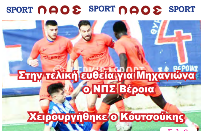
Στην τελική ευθεία για Μηχανιώνα ο ΝΠΣ Βέροια