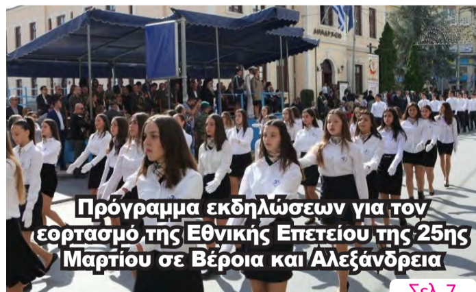
Πρόγραμμα εκδηλώσεων για τον εορτασμό της Εθνικής Επετείου της 25ης Μαρτίου σε Βέροια και Αλεξάνδρεια