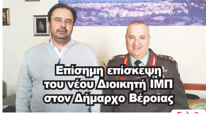
Επίσημη επίσκεψη του νέου/Διοικητή ΙΜΠ στον/Δήμαρχο Βέροιας