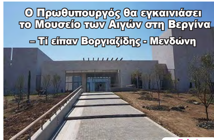
Ο Πρωθυπουργός θα εγκαινιάσει το Μουσείο των Αιγών στη Βεργίνα - Τί είπαν Βοργιαζίδης - Μενδώνη