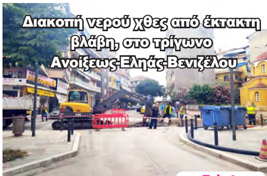
Διακοπή νερού χθες από έκτακτη βλάβη, στο τρίγωνο Ανοιξιας-Εληάς-Βενιζέλου