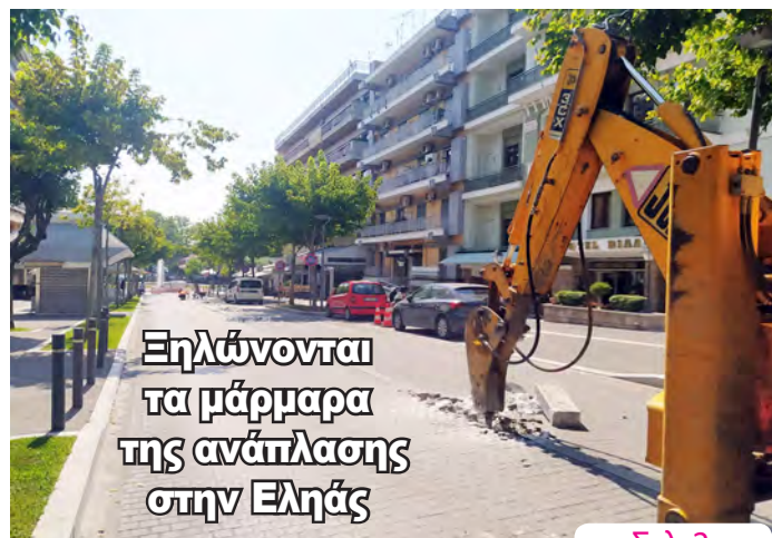
Ξηλώνονται τα μάρμαρα της ανάπλασης στην Εληάς