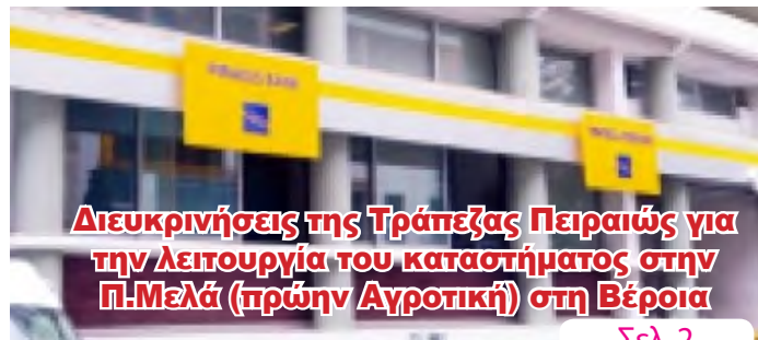
Διευκρινήσεις της Τράπεζας Πειραιώς για την λειτουργία του καταστήματος στην Π.Μελά (πρώην Αγροτική) στη Βέροια