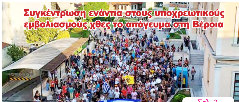
Συγκέντρωση ενάντια στους υποχρεωτικούς εμβολιασμούς χθες το απόγευμα στη Βέροια