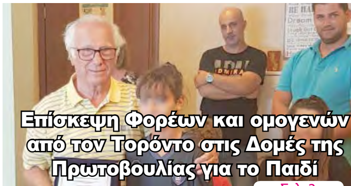
Επίσκεψη Φορέων και ομογενών από τον Τορόντο στις Δομές της Πρωτοβουλίας για το Παιδί