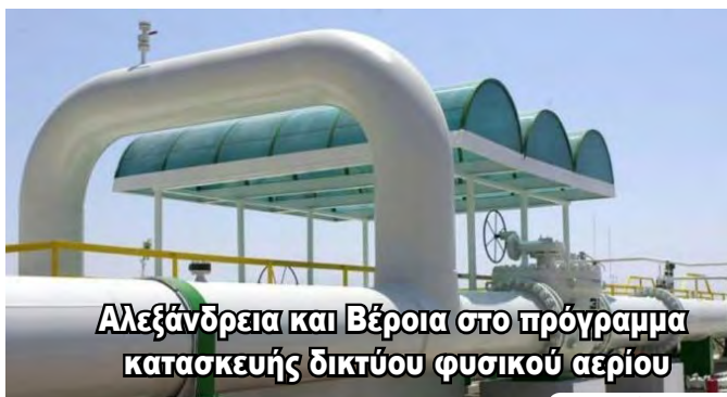
Αλεξάνδρεια και Βέροια στο πρόγραμμα κατασκευής δικτύου φυσικού αερίου