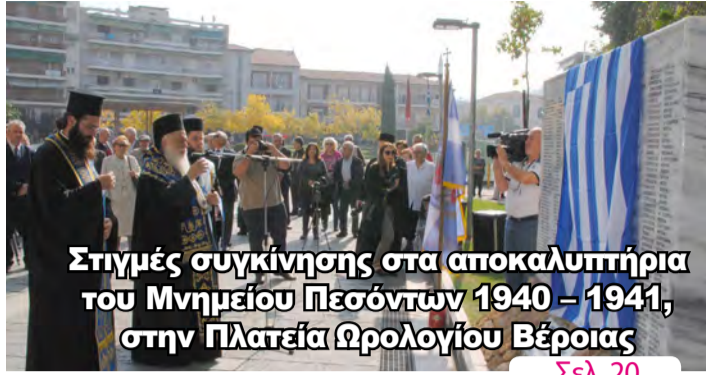
Στιγμές συγκίνησης στα αποκαλυπτήρια του Μνημείου Πεσόντων 1940 - 1941, στην Πλατεία Ωρολογίου Βέροιας