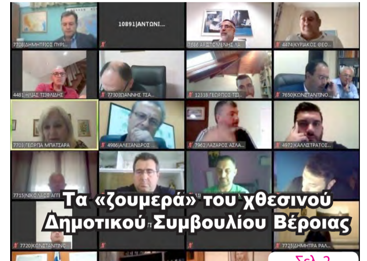
Τα «ζουμερά» του χθεσινού Δημοτικού Συμβουλίου Βέροιας

ΑΔΕΣΜΕΥΤΗ ΚΑΘΗΜΕΡΙΝΗ ΕΦΗΜΕΡΙΔΑ ΤΟΥ ΝΟΜΟΥ ΗΜΑΘΙΑΣ