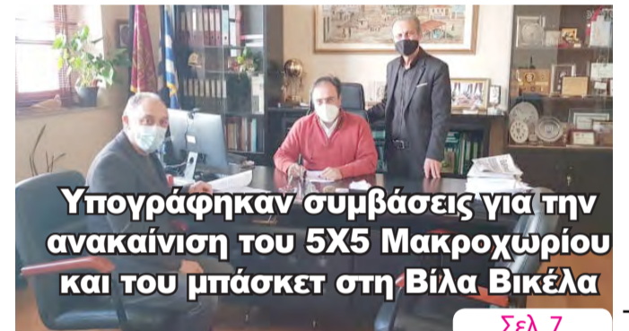
Υπογράφηκαν συμβάσεις για την ανακαίνιση του 5Χ5 Μακροχωρίου και του μπάσκετ στη Βίλα Βικέλα