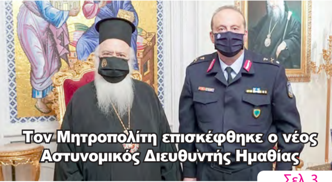
Τον Μητροπολίτη επισκέφθηκε ο νέος Αστυνομικός Διευθυντής Ημαθίας