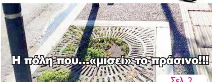
Η πόλη που...«μισεί» το πράσινο!!!