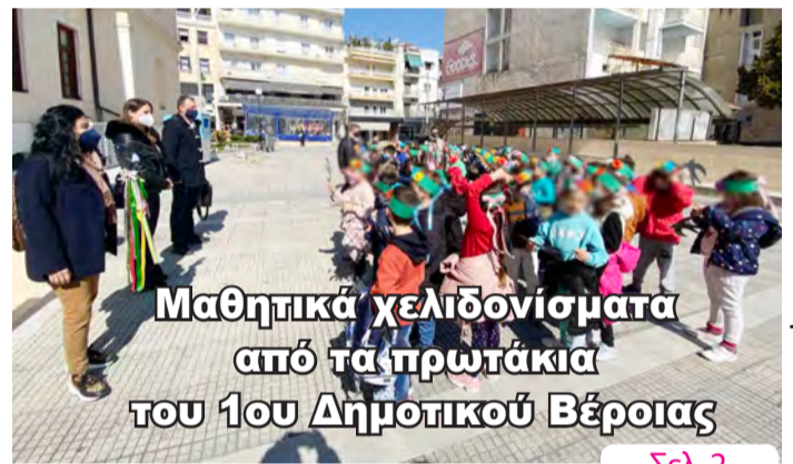
Μαθητικά χελιδονίσματα από τα πρωτάκια του 1ου Δημοτικού Βέροιας