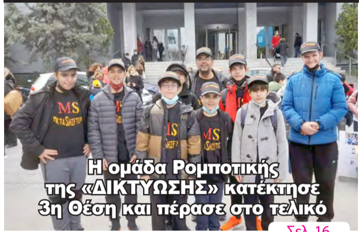
Η ομάδα Ρομποτικής της «ΔΙΚΤΥΩΣΗΣ» κατέκτησε 3η Θέση και πέρασε στο τελικό

Μεγάλη διάκριση για την Βέροια στο διαγωνισμό Ρομποτικής της LEGO