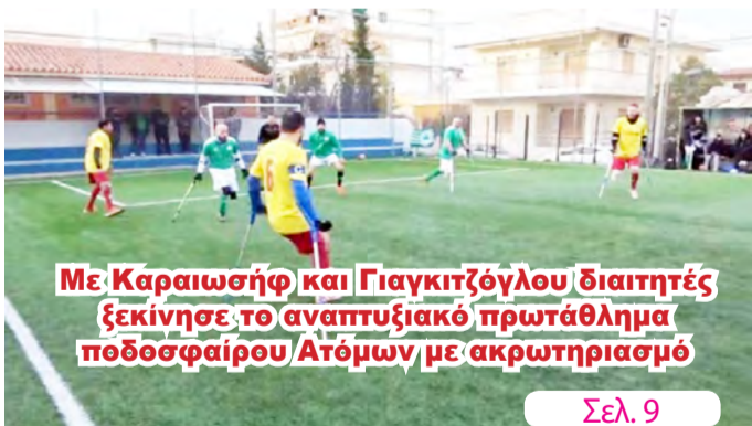
Με Καραιωσήφ και Γιαγκιτζόγλου διαιτητές ξεκίνησε το αναπτυξιακό πρωτάθλημα ποδοσφαίρου Ατόμων με ακρωτηριασμό