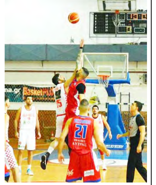
19, Ράπτης 9, Οικονομόπουλος 16 (3), Μαργέλης, Βασιλόπουλος 4 (1), Σκουλίδας.

Χ. Τρικούπης (Καλαμπάκος): Παπαδιονυσίου 22 (1), Αντωνιάδης 6, Ναούμης 5 (1), Σαχπατζίδης