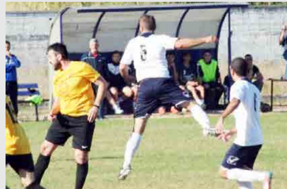
Ρεπό : Μακροχώρι