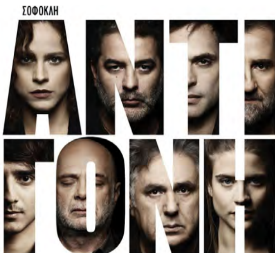
ΣΚΗΝΟΘΕΣΙΑ: Cezaris Grauzinis

Την επόμενη του Εμφυλίου στη Θήβα, οι χθεσίοι προστάτες της πόλης γιορ-