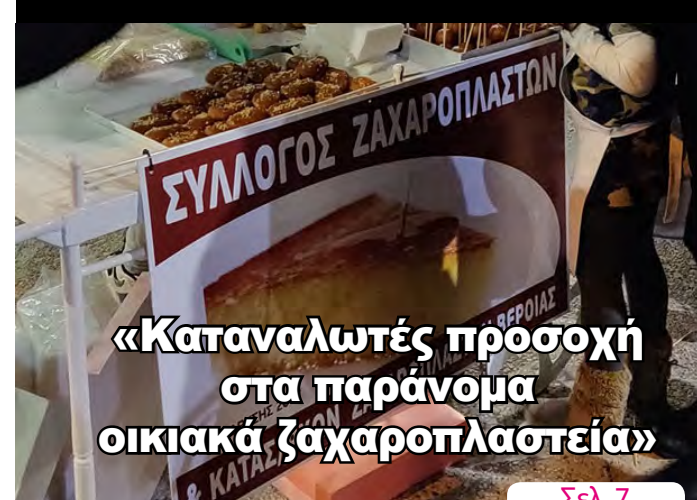
«Καταναλωτές προσοχή στα παράνομα οικιακά ζαχαροπλαστεία»