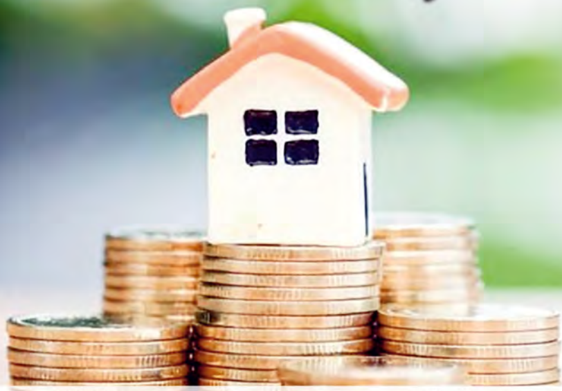
Τρέχουν να προλάβουν προθεσμίες και να κλείσουν εκκρεμότητες