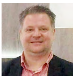
Συγκροτήθηκε σε Σώμα το νέο Δ.Σ. του Α.Π.Σ.