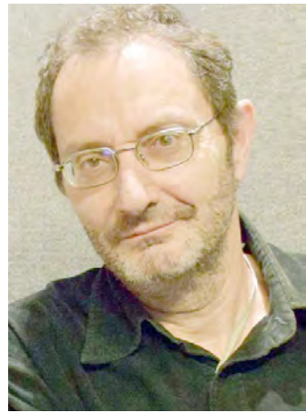
Του Γιάννη Γεωργουδάκη*

Σε μια χώρα μακρινή κι ονειρεμένη, ο κύριος Χουάν ο Διευθυντής ανοίγει στις 8.00 το Σχολείο και ξεκινάει την καθημερινή του ρουτίνα. Ενημερώνεται για την αλληλογραφία από τον Η/Υ, ελέγχει τον χώρο για πιθανά προβλήματα, ανοίγει τα καλοριφέρ και στέλνει έγγραφα στην Διεύθυνση και στις τεχνικές υπηρεσίες για τα καθημερινά «μερεμέτια». Βλέπετε δεν υπάρχει γραμματειακή αλλά ούτε και τεχνική υποστήριξη καθώς η πολιτεία δεν θεώρησε ότι κάτι τέτοιο θα μπορούσε να είναι πρόβλημα σε ένα σχολείο του 21ου αιώνα. Ο κύριος Χουάν είναι τρία χρόνια Διευθυντής στο σχολείο. Έμαθε τη «δουλειά» και θεωρεί πως είναι πλέον ώριμος και πετυχημένος. Ανέθεσε κατά γράμμα τις εξωδιδακτικές εργασίες στους υφιστάμενους με το ξεκίνημα της χρονιάς, εκτελεί κατά γράμμα τις εντολές των ανωτέρων, συγκαλεί το σύλλογο διδασκόντων όποτε χρειάζεται και όλα δουλεύουν ρολόι ή... περίπου ρολόι. Βλέπεις από την αρχή της χρονιάς υπάρχουν πολλά κενά εκπαιδευτικών στο σχολείο, ενώ ταυτόχρονα υπάρχουν εγκυμονούσες σε άδεια. Σήμερα όμως είναι μια σημαντική μέρα, καθώς θα έρθουν στο σχολείο οι πρώτοι αναπληρωτές και επιτέλους τα παιδιά θα πάψουν να διαμαρτύρονται και να σουλατσάρουν άσκοπα στην αυλή. Ποιοι είναι οι αναπληρωτές, ή τι προσόντα έχουν, δεν ξέρει και δεν τον αφορά κιόλας. Του αρκεί που θα «κουμπώσουν» στο πρόγραμμα. Έτσι άλλωστε γινόταν πάντα.