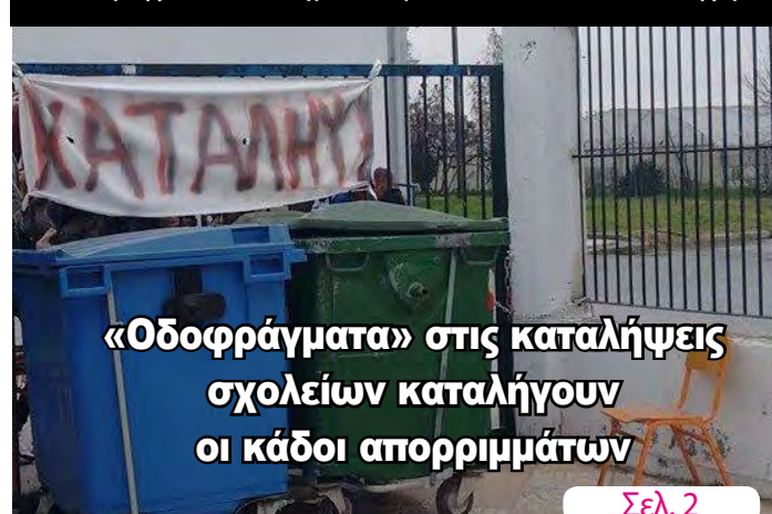
«Οδοφράγματα» στις καταλήψεις σχολείων καταλήγουν οι κάδοι απορριμμάτων