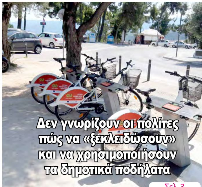
Δεν γνωρίζουν οι πολίτες πώς να «ξεκλειδώσουν» και να χρησιμοποιήσουν τα δημοτικά ποδήλατα