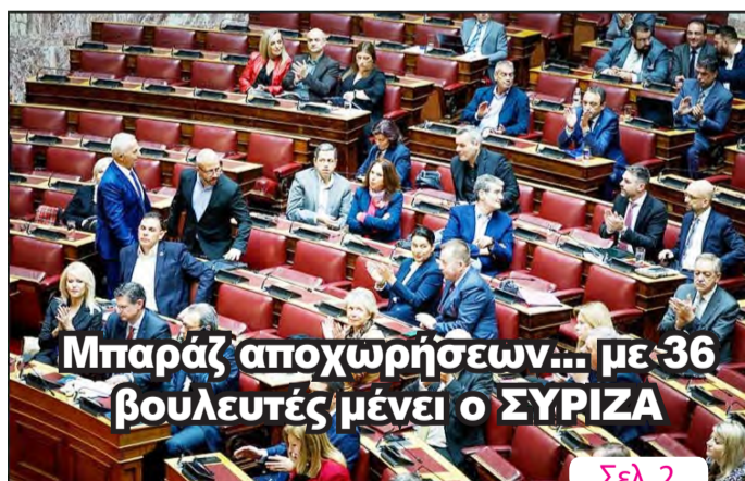
Μπαράζ αποχωρήσεων... με 36 βουλευτές μένει ο ΣΥΡΙΖΑ