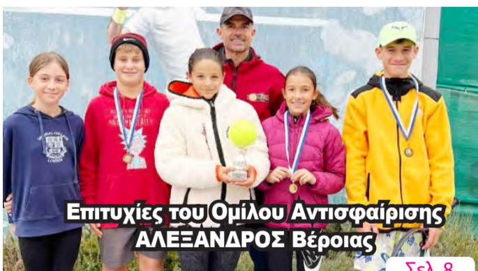
Επιτυχίες του Ομίλου Αντισφαίρισης ΑΛΕΞΑΝΔΡΟΣ Βέροιας