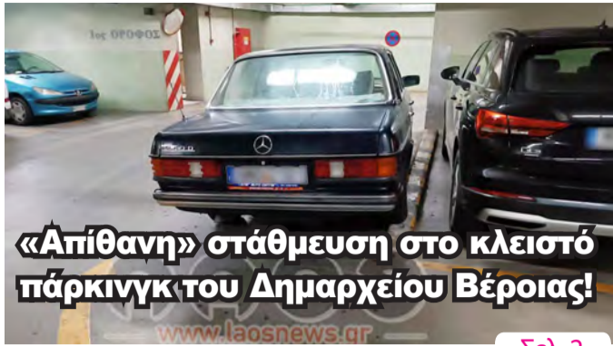
«Απίθανη» στάθμευση στο κλειστό πάρκινγκ του Δημαρχείου Βέροιας!