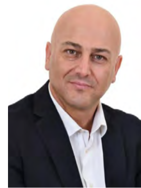
Ερώτηση των βουλευτών Κοτίδη και Κουπελόγλου για τους απλήρωτους από τον ΕΛΓΑ παραγωγούς της Ημαθίας

ΑΔΕΣΜΕΥΤΗ ΚΑΘΗΜΕΡΙΝΗ ΕΦΗΜΕΡΙΔΑ ΤΟΥ ΝΟΜΟΥ ΗΜΑΘΙΑΣ