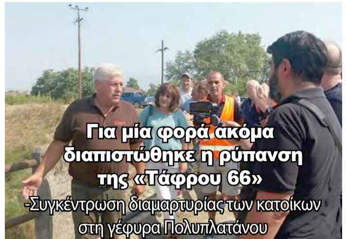
Για μία φορά ακόμα διαπιστώθηκε η ρύπανση της «Τάφρου 66»

-Συγκέντρωση διαμαρτυρίας των κατοίκων στη γέφυρα Πολυπλατάνου