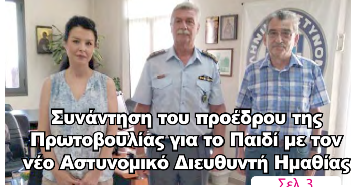
Συνάντηση του προέδρου της Πρωτοβουλίας για το Παιδί με τον νέο Αστυνομικό Διευθυντή Ημαθίας