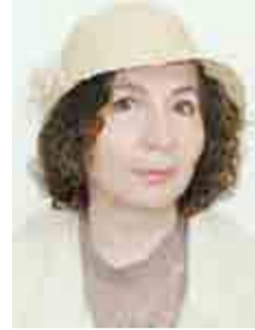
Γράφει η Νανά Στ. Παπαϊωάννου Φιλολόγος- λογοτέχνης

Ατομισμός, μία έννοια που συναντάται, ιδιαίτερα, στις σύγχρονες κοινωνίες και εκφράζει την περιχαράκωση του ανθρώπου, γύρω από τον εαυτό του, την απομόνωσή του από το κοινωνικό σύνολο. Η ετυμολογία της λέξης (-α- στερητικό+τομή<ρ.τέμνω)