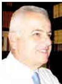
Γράφει ο ΑΝΑΣΤΑΣΙΟΣ ΒΑΣΙΛΑΔΗΣ

Έχει παγιωθεί ως μόδα τα τελευταία χρόνια τέτοια εποχή, να υποδέχεται η ελληνική αγορά την λεγόμενη «Μαύρη Παρασκευή», τον ξενόφερτο θεσμό που έγινε γενικότερα γνωστός υπό την αγγλόφωνη εκδοχή του ως «Black Friday», σαν μια προσπάθεια αύξησης του τζίρου μέσω γενικευμένων εκπτώσεων των τιμών στα προϊόντα που διατίθενται προς πώληση.