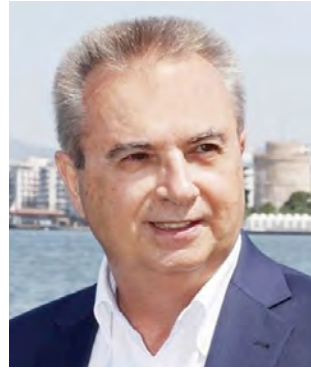
Του Γιάννη Μαγκριώτη

Ο Πρωθυπουργός στο Νταβός μίλησε για την επιτυχία της κυβέρνησης στην οικονομία και τις υψηλές ξένες επενδύσεις στην χώρα μας, την τετραετία της διακυβέρνησής του.