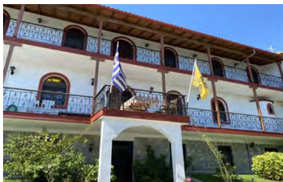
Το κεντρικό κτίριο στην Ιερά Μονή Παναγίας Γλυκοφιλούσας στη Ραψάνη

Ο ΠΡΟΕΔΡΟΣ Ο ΓΕΝ. ΓΡΑΜΜΑΤΕΑΣ ΜΑΥΡΟΠΟΥΛΟΣ ΓΕΩΡΓΙΟΣ ΑΓΙΟΛΙΤΗΣ ΓΕΩΡΓΙΟΣ