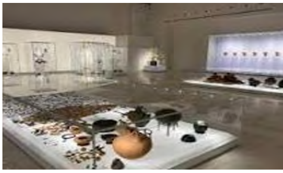
Μία από τις πολλές αίθουσες του Πολυκεντρικού Μουσείου των Αιγών γεμάτη με αρχαιολογικά ευρήματα της περιοχής

ΕΛΛΗΝΙΚΗ ΔΗΜΟΚΡΑΤΙΑ ΝΟΜΟΣ ΗΜΑΘΙΑΣ ΔΗΜΟΣ ΒΕΡΟΙΑΣ ΔΙΕΥΘΥΝΣΗ ΟΙΚΟΝΟΜΙΚΩΝ ΥΠΗΡΕΣΙΩΝ ΤΜΗΜΑ ΠΡΟΜΗΘΕΙΩΝ ΚΑΙ ΑΠΟΘΗΚΩΝ Κωδικός ΝΥΣ: EL521 Αρ. Πρωτ. 27971/24-5-2023