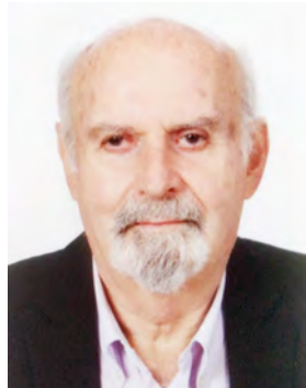
Του Μάκη Δημητράκη

Η «Ανάληψη» είναι Δεσποτική εορτή και η λέξη στην Καινή Διαθήκη αντιπροσωπεύει τη μετάβαση του Χριστού στους ουρανούς. Θεωρείται στην εκκλησιαστική παράδοση ως η ολοκλήρωση της αποστολής του Κυρίου επί της γης.