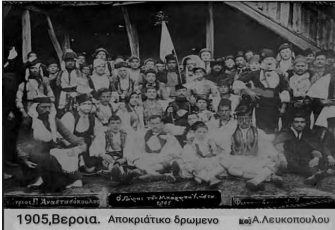
1905, Βεροια. Αποκριάτικο δρώμενο

Παρακολούθησα χθες την εξαιρετικά ενδιαφέρουσα εκδήλωση που οργάνωσε η Ε.Μ.Ι.Π.Η. στο Φουαγιέ της Στέγης Γραμμάτων και Τεχνών της Βέροιας με θέμα "Όψεις και πτυχές της Αποκρίας στη Βέροια και τη Νάουσα" με ομιλητές τον Μανώλη Ξυνάδα και τον Τάκη Μπάιτη. Θυμήθηκα λοιπόν ότι είχα «αλιεύσει» από το διαδίκτυο (από τις παλιές φωτογραφίες της Βέροιας;) μία καταπληκτική φωτογραφία, που δείχνει ένα πολυπληθή όμιλο ανδρών διασκεδαστών της Αποκρίας μεταμφιεσμένων με διάφορες παραδοσιακές φορεσιές, η οποία αξίζει να σχολιασθεί: