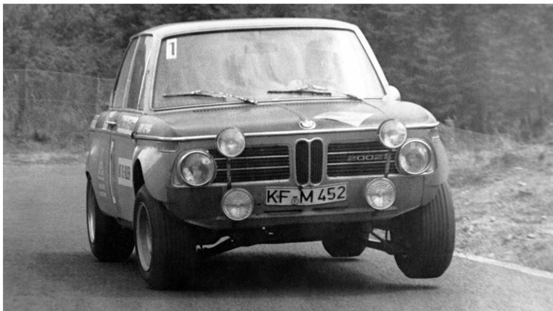
Αγωνιστική BMW (αρχείο)

Σύμφωνα με την προκήρυξη της ΕΛΠΑ στον αγώνα μπορούσαν να συμμετέχουν αυτοκίνητα 4 κατηγοριών: