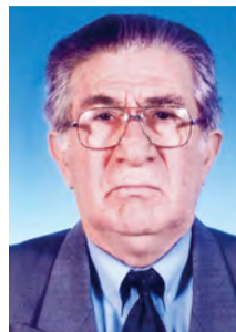
Γράφει ο Παναγιώτης Παπαδόπουλος Φιλολόγος

«Πάσχα, Κυρίου Πάσχα. Πάσχα πανσεβάσμιον ημίν ανέτειλε».