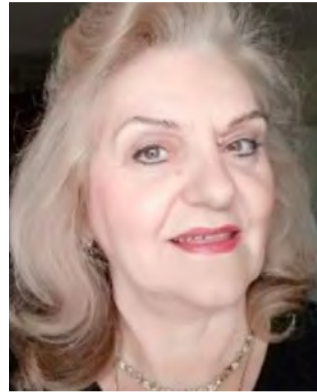
Γράφει η Αναστασία Πάπαρη Δρ Αρχιτέκτων - Πολεοδόμος

Την Τετάρτη 24 Μαΐου 2023, ήταν η Ευρωπαϊκή Ημέρα Πάρκων. Η Ομοσπονδία των Πάρκων της Ευρώπης (EUROPARK Federation) καλεί εφέτος τους Ευρωπαίους να «οικοδομήσουν πάνω στις ρίζες τους». Να εξερευνησουν την κληρονομιά τους για τα Πάρκα και τις Προστατευμένες Περιοχές. Όπως