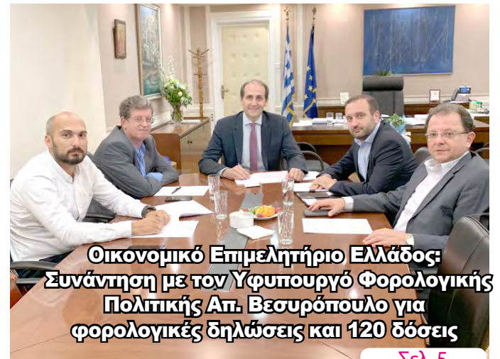
Οικονομικό Επιμελητήριο Ελλάδος: Συνάντηση με τον Υφυπουργό Φορολογικής Πολιτικής Απ. Βεσυρόπουλο για φορολογικές δηλώσεις και 120 δόσεις

ΑΔΕΣΜΕΥΤΗ ΚΑΘΗΜΕΡΙΝΗ ΕΦΗΜΕΡΙΔΑ ΤΟΥ ΝΟΜΟΥ ΗΜΑΘΙΑΣ