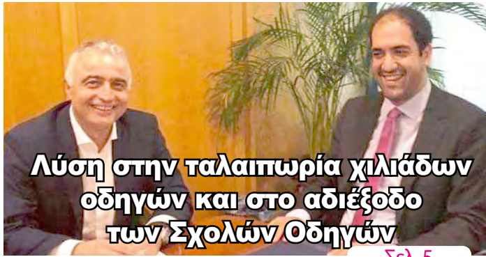
Λύση στην ταλαιπωρία χιλιάδων οδηγών και στο αδιέξοδο των Σχολών Οδηγών