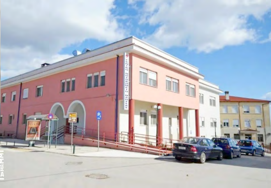
ΚΟΙΝΟΣ ΤΟΠΟΣ ΟΜΑΔΑ ΣΧΕΔΙΑΣΜΟΥ & ΔΡΑΣΗΣ ΝΑΟΥΣΑΣ

Η κατά πλειοψηφία απόφαση του Διοικητικού Συμβουλίου του Νοσοκομείου Ημαθίας για την μετακίνηση τον μήνα Αύγουστο, αναισθησιολόγου υπηρετούντος στη μονάδα της Νάουσας, σε αυτή της Βέροιας για να καλυφθεί το κενό που άφησε η παραίτηση αναισθησιολόγου από τη μονάδα της Βέροιας είναι ανεπίτρεπτη και στερείται λογικής.