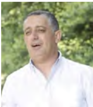
Ο Βλάχος τραγουδιστής Φώτης Τράσιας