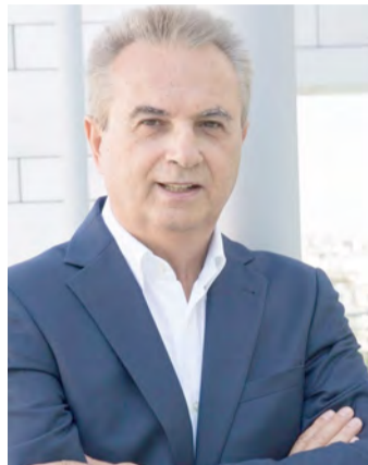
Του Γιάννη Μαγκριώτη

Ο Πρωθυπουργός και οι ηγεσίες των κομμάτων βλέπουν στα αποτελέσματα των εκλογών, τις εικόνες που τους αρέσουν. Η πραγματικότητα όμως, είναι διαφορετική, έχει πολλές ασυμβατότητες με τις αναγνώσεις των κομμάτων. Η κομματική αισιοδοξία είναι κατανοητή, όμως, όταν δεν ακουμπά στην πραγματικότητα δημιουργεί αυταπάτες. Όλοι ξέρουμε που οδηγούν οι αυταπάτες.