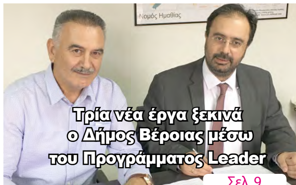
Τρία νέα έργα ξεκινά ο Δήμος Βέροιας μέσω του Προγράμματος Leader