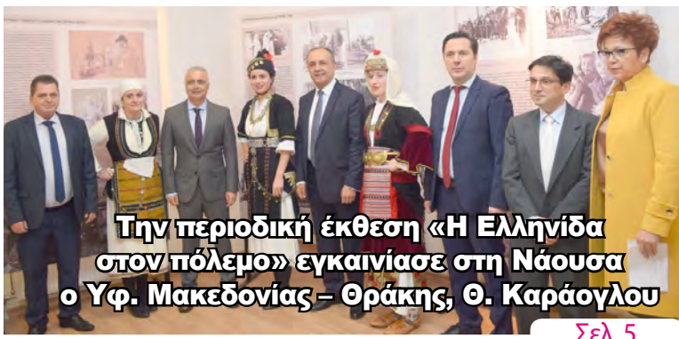
Την περιοδική έκθεση «Η Ελληνίδα στον πόλεμο» εγκαινίασε στη Νάουσα ο Υφ. Μακεδονίας - Θράκης, Θ. Καράογλου