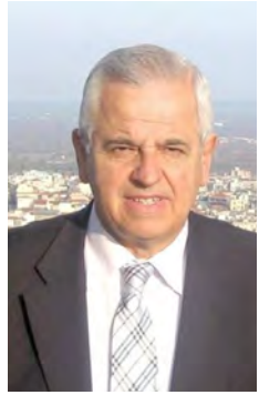
Γράφει ο ΑΝΑΣΤΑΣΙΟΣ ΒΑΣΙΛΙΔΗΣ

Μέσα σε ατμόσφαιρα στην οποία κυριαρχεί η αίσθηση της πόλωσης, εξελίχθηκε η συζήτηση στην Βουλή των Ελλήνων, για ένα από τα πλέον σημαντικά κεφάλαια της εν εξελίξει συνταγματικής ανα-