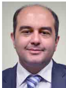
Γράφει ο Χρήστος Α. Αποστολίδης*

Η συγκλονιστική παρουσία εκατοντάδων χιλιάδων συμπολιτών μας στο συλλαλητήριο της 21ης Ιανουαρίου στη Θεσσαλονίκη είναι αλήθεια ότι ξάφνιασε. Άνθρωποι κάθε ηλικίας, προερχόμενοι από ποικίλα κοινωνικά και μορφωτικά στρώματα κατέκλυσαν την παραλία της Νύμφης του Θερμαϊκού διατρανώνοντας την εδραία πεποίθησή τους ότι η Μακεδονία είναι μία και ελληνική.