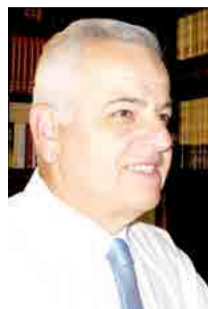
Γράφει ο ΑΝΑΣΤΑΣΙΟΣ ΒΑΣΙΑΔΗΣ