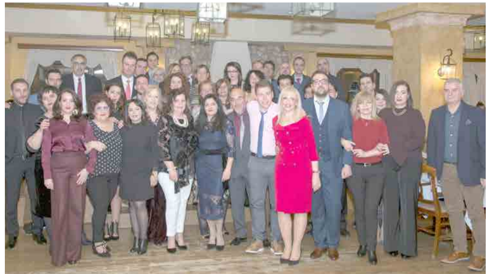
ΔΙΕΥΘΥΝΣΗ ΓΡΑΦΕΙΟΥ ΠΑΡΑΓΩΓΗΣ ΑΝΘΗΣ ΞΗΡΟΥ

Η Διεύθυνση Γραφείων Παραγωγής Ανθής Ξηρού της Εθνικής Ασφαλιστικής έκοψε την πίτα το Σάββατο 20 Ιανουαρίου 2018 στο «Αιγές Μέλαθρον» στην πόλη της Βέροιας, γιορτάζοντας την επίτευξη του στόχου της 1ης θέσης σε παραγωγική δραστηριότητα στην περιφερειακή Ελλάδα, αλλά και την κατάκτηση της 4ης θέσης ανάμεσα σε όλες της παραγωγικές Διευθύνσεις της Εθνικής Ασφαλιστικής σε όλη την Ελλάδα. Η Διοίκηση της εταιρείας βράβευσε τα στελέχη και τους ασφαλιστικούς συμβούλους που διακρίθηκαν για τις παραγωγικές τους επιδόσεις το 2017.