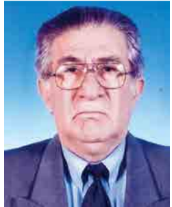
Γράφει ο Παναγιώτης Παπαδόπουλος Φιλολόγος