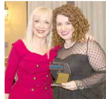
ΧΡΟΝΗ ΕΙΡΗΝΗ 7ο ΒΡΑΒΕΙΟ