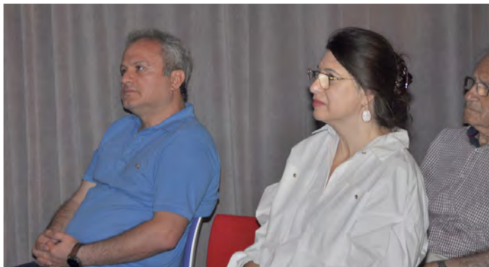
εθελοντική της στήριξη και βοήθεια, τη Δημόσια Κεντρική Βιβλιοθήκη Βέροιας. Θα επανέλθουμε γιατί Η ΨΥΧΙΚΗ ΥΓΕΙΑ ΜΑΣ ΑΦΟΡΑ ΟΛΟΥΣ ! ΤΟ Δ.Σ.

Πραγματοποιήθηκε το Σάββατο 24 Ιουνίου 2023 η εκδήλωση που οργάνωσε ο ΣΟΦΨΥ Ημαθίας στη Δημόσια Κεντρική Βιβλιοθήκη Βέροιας. Τα θέματα της εκδήλωσης ήταν «ΤΕΧΝΗ & ΨΥΧΙΚΗ ΥΓΕΙΑ» και «ΣΤΙΓΜΑ & ΨΥΧΙΚΗ ΥΓΕΙΑ».