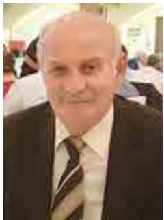
Του Μάκη Δημητράκη

Αναμφίβολα, ο τουρισμός (εσωτερικός και εξωτερικός) αποτελεί κλάδο της αποκαλούμενης «βαριάς Ελληνικής βιομηχανίας» με όλες του τις μορφές. Ιστορικός, αρχαιολογικός, παραθεριστικός, επιστημονικός-συνεδριακός, θρησκευτικός, αγροτουρισμός κ.ά.