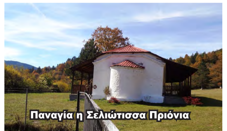
Παναγία η Σελιώτισσα Πριόνια

Τα τελευταία χρόνια έγιναν προσπάθειες το χωριό (Άνω Σέλι) να ξαναδημιουργηθεί, αλλά μέχρι στιγμής λίγα μόνο παραθεριστικά σπίτια κτίστηκαν και υπάρχει η ελπίδα το χωριό να ξαναγεννηθεί, αφού βέβαια ξανακτίστηκε η εκκλησία Κωνσταντίνου και Ελένης.