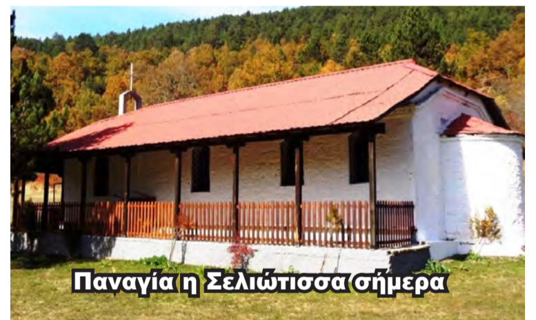
Παναγία η Σελιώτισσα σήμερα