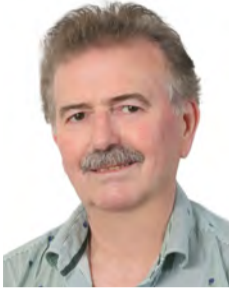
Του Γιάννη Κ. Τσιαμήτρου

Δεν έχουμε πολλά ιστορικά στοιχεία για την εκκλησία της 'Παναγίας της Σελιώτισσας', η οποία γιορτάζεται στη περιοχή 'Πριόνια' του Βερμίου. Συγκεκριμένα στις 23 Αυγούστου η εκκλησία μας γιορτάζει την Απόδοση της Κοιμήσεως της Θεοτόκου, που σημαίνει στην εκκλησιαστική γλώσσα την ολοκλήρωση μιας μεγάλης χριστιανικής εορτής. Ο λαός τιμά τη μητέρα του Θεού, ως μνημόσυνο, και αποκαλεί την ημέρα αυτή τα 'Εννιάμερα της Παναγίας', όπως κάνει, άλλωστε, και για τους δικούς του ανθρώπους.