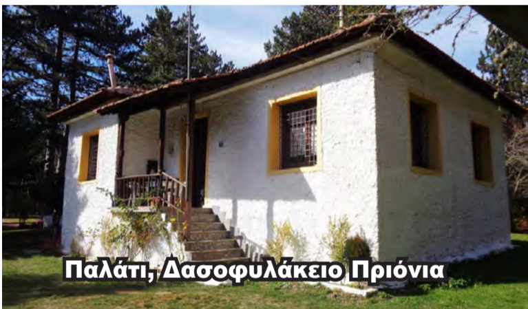
Παλάτι, Δασοφυλάκειο Πριόνια