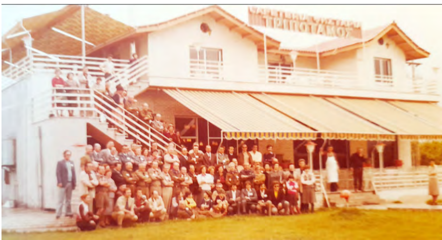
Αναμνηστική φωτογραφία μετά το γεύμα στο κέντρο «Τριπόταμος»

Η ορχήστρα του Β' Σ.Σ. με ένα πλοίο προσκοπικό ρεπερτόριο δημιούργησε