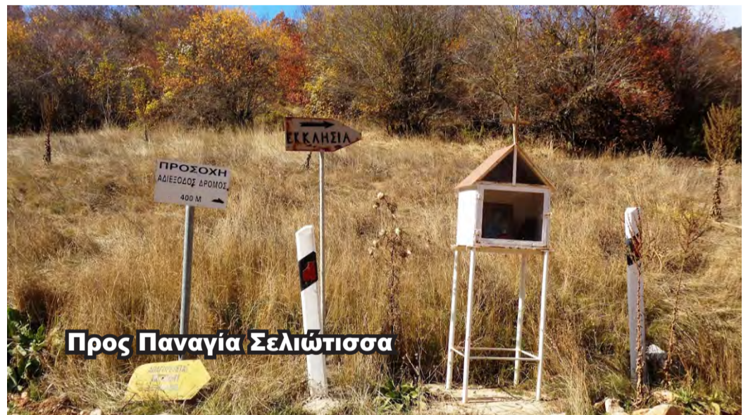
Προς Παναγία Σελιώτισσα