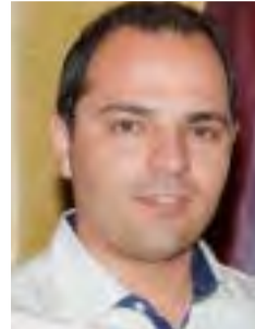
Γράφει ο Τόφης Αθανάσιος*

Ναι ... επιτέλους καλοκαίρι και εκτός από αναζωογόνηση ξεγνοιασιά κέφι και πολύ χαρά μας προσφέρει ευκαιρίες για καλύτερευση της υγείας μας με πολλές νόστιμες και υγιεινές διατροφικές επιλογές. Μπορούμε φέτος το καλοκαίρι να θέσουμε τις βάσεις για καλύτερη διατροφή και περισσότερη κίνηση με άμεσο αποτέλεσμα στο βάρος αλλά και στη γενικότερη υγεία μας!