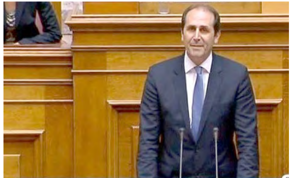
ΑΠΟΣΤΟΛΟΣ ΒΕΣΥΡΟΠΟΥΛΟΣ Βουλευτής Ν. Ημαθίας

Ενισχύεται το προσωπικό του ΕΛΓΑ στην Ημαθία για να επιταχυνθεί η διαδικασία εκτίμησης των ζημιών και της καταβολής των αποζημιώσεων.