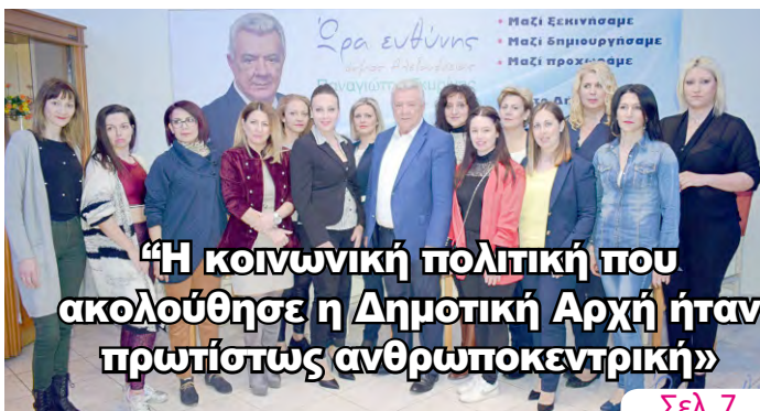
«Η κοινωνική πολιτική που ακολούθησε η Δημοτική Αρχή ήταν πρωτίστως ανθρωποκεντρική»