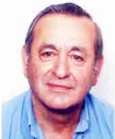
Γράφει ο Πάυλος Πυρινός Πρώην Τοπικός Έφορος

Το 1945, η τότε κυβέρνηση, με το νόμο 112/1945 επανασύστησε το Σύμμα Ελλήνων Προσκόπων Ελλάδος.