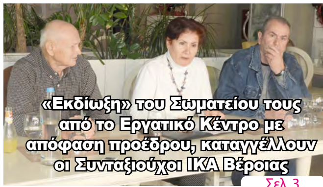
«Εκδίωξη» του Σωματίου τους από το Εργατικό Κέντρο με απόφαση προέδρου, καταγγέλλουν οι Συνταξιούχοι ΙΚΑ Βέροιας