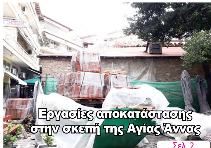
Εργασίες αποκατάστασης στην οκεπή της Αγίας Άννας