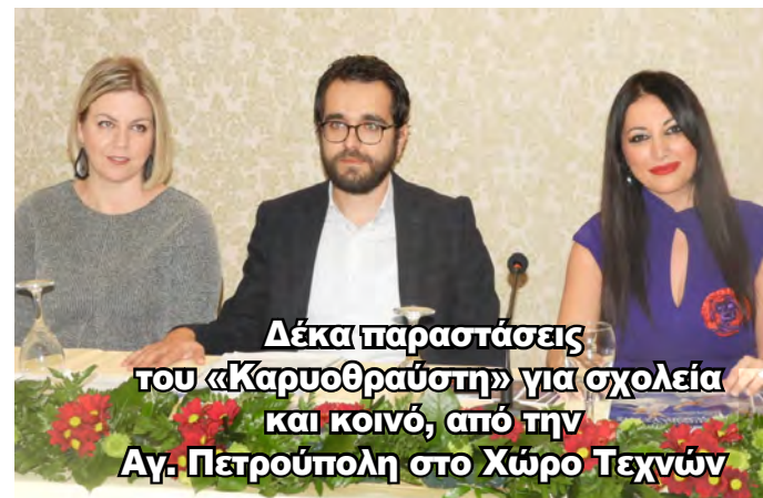
Δέκα παραστάσεις του «Καρυοθραύστη» για σχολεία και κοινό, από την Αγ. Πετρούπολη στο Χώρο Τεχνών

ΑΔΕΣΜΕΥΤΗ ΚΑΘΗΜΕΡΙΝΗ ΕΦΗΜΕΡΙΔΑ ΤΟΥ ΝΟΜΟΥ ΗΜΑΘΙΑΣ