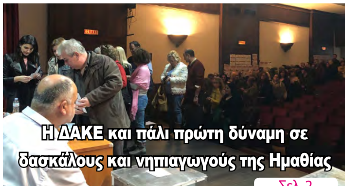
Η ΔΑΚΕ και πάλι πρώτη δύναμη σε δασκάλους και νηπιαγωγούς της Ημαθίας