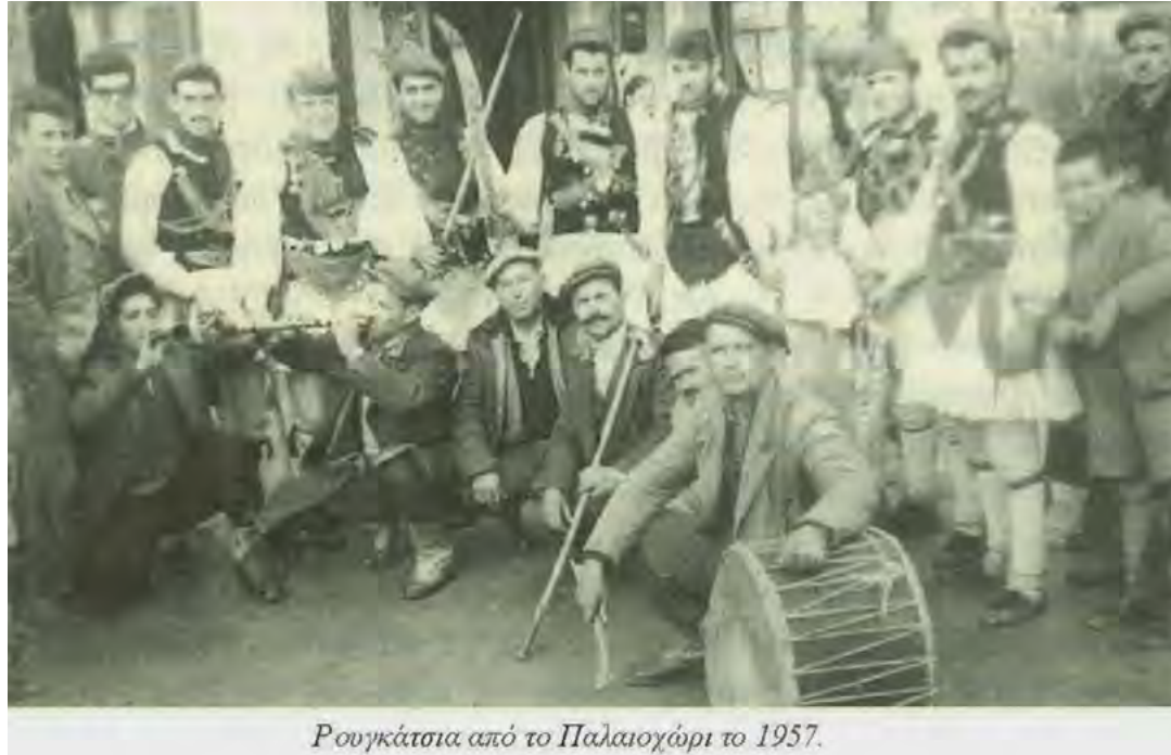
Ρουγκάτσια από το Παλαιοχώρι το 1957.

Ο «πατέρας» της λαογραφίας μας Ν. Πολίτης ισχυρίζεται πως η λέξη ρουγκάτσια προέρχεται από το λατινικό ρήμα Rogo που σημαίνει ζήτηση, απαίτηση και κατά συνέπεια «ρουγκάτσια» είναι αυτοί που ζητούν, που θέλουν ενίσχυση, δηλαδή βοήθεια. Την εκδοχή αυτή δέχεται και ο δικηγόρος και για πολλά χρόνια ερευνητής της ιστορίας και λαογραφίας Γιάννης Μοσχόπουλος από την Αλεξάνδρεια (Γιδός) ο οποίος αναφέρει μεταξύ