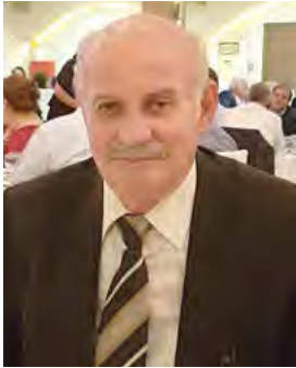
Έρευνα-Επιμέλεια: Μάκης Δημητράκης

Τα τελευταία χρόνια, όλο και περισσότερο, βλέπουμε από πολιτιστικούς συλλόγους να αναβιώνουν στις πόλεις και τα χωριά του Ρουμλουκιού. Η καρδιά του ημαθιώτικου κάμπου με περισσότερα από 40 χωριά, με κέντρο της Αλεξάνδρεια (Γηδός-Γιδός) είναι γνωστή με την ονομασία Ρουμλούκι ή Ουρουμλούκι (έτσι ονόμαζαν την περιοχή οι Τούρκοι). Η λέξη θεωρείται σύνθετη από τις λέξεις «(ου) ρούμ» που σημαίνει Ρωμικός-Ελληνας και το «λουκ» που προέρχεται από τη λατινική λέξη Locus-ι που σημαίνει τόπος. Έτσι Ρουμλούκι σημαίνει ρωμιότοπος, ρωμαίικο, ελληνόχωρα, ελληνότοπος, ρωμιόσυνη) τα «Ρουγκάτσια». Ένα πολύ παλιό έθιμο που οι ρίζες του χάνονται βαθιά στο παρελθόν. Πιθανόν στις αρχές της βυζαντινής αυτοκρατορίας, την εποχή του αυτοκράτορα Λέοντα του ΣΤ', τότε που τα θέματα (επαρχίες) φύλαγαν μισθοφόροι, οι οποίοι μία φορά τον χρόνο περιόδευσαν τις κατοικημένες περιοχές που επιτηρούσαν για να εισπράξουν την αμοιβή τους από τους κατοίκους. Την εκδοχή αυτή «ασπάζεται» και ο λαογράφος Γιώργος Μελικής γι' αυτό υποστηρίζει πως ρουγκάτσια σημαίνει μισθοφόροι.