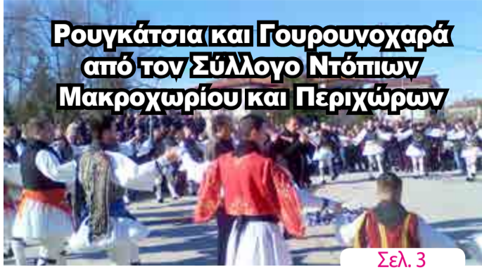
Ρουγκάτσια και Γουρουνοχαρά από τον Σύλλογο Ντόπιων Μακροχωρίου και Περιχώρων