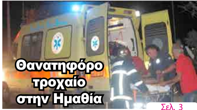
Θανατηφόρο τροχαίο στην Ημαθία