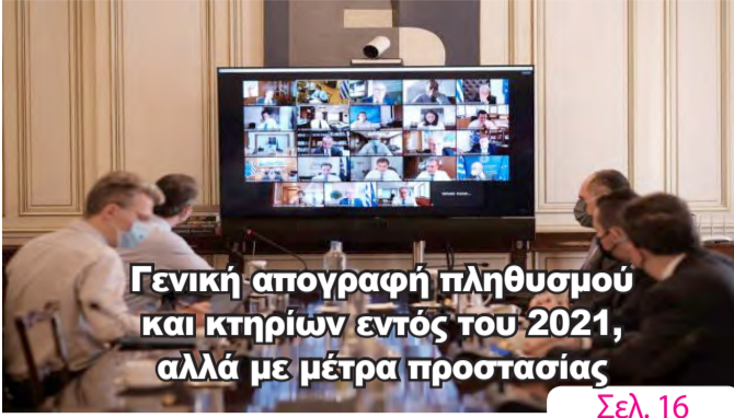
Γενική απογραφή πληθυσμού και κτηρίων εντός του 2021, αλλά με μέτρα προστασίας