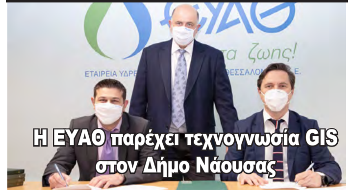
Η ΕΥΑΘ παρέχει τεχνογνωσία GIS στον Δήμο Νάουσας

Μνημόνιο συνεργασίας μεταξύ των δύο πλευρών