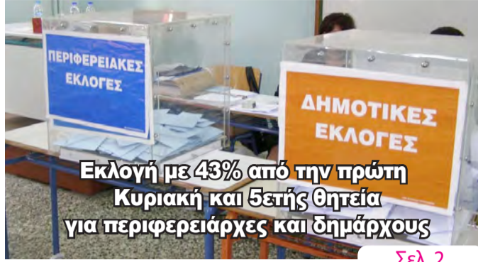
Εκλογή με 43% από την πρώτη Κυριακή και 5ετής θητεία για περιφερειάρχες και δημάρχους