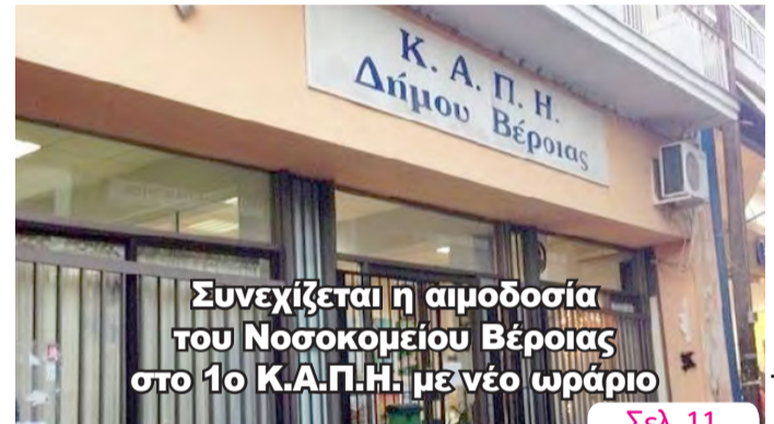
Συνεχίζεται η αιμοδοσία του Νοσοκομείου Βέροιας στο 1ο Κ.Α.Π.Η. με νέο ωράριο