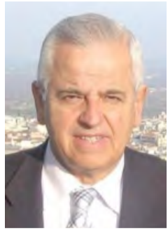
Γράφει ο: Βασίλειος Βασιλάδης

Η επιτακτική επικαιρότητα της επιδημικής κρίσης του κορωνοϊού και τα περιοριστικά μέτρα που εξαγγέγονται, είναι φυσικό να μονοπωλούν το γενικότερο ενδιαφέρον και να το αποσπούν από την παρακολούθηση της νομοθετικής εξέλιξης η οποία συντελείται.