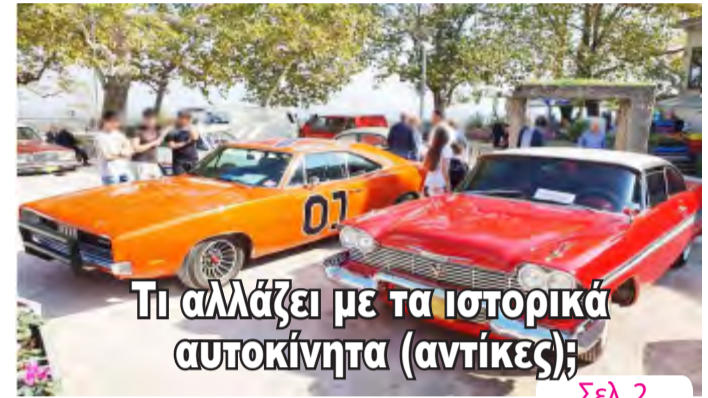
Τι αλλάζει με τα ιστορικά αυτοκίνητα (αντίκες);

ΑΔΕΣΜΕΥΤΗ ΚΑΘΗΜΕΡΙΝΗ ΕΦΗΜΕΡΙΔΑ ΤΟΥ ΝΟΜΟΥ ΗΜΑΘΙΑΣ