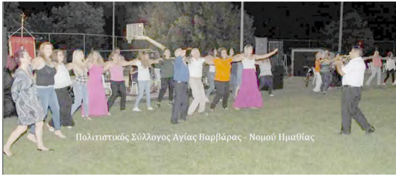
Πολιτιστικός Σύλλογος Αγίας Βαρβάρας - Νομού Ημαθίας

Ραντεβού στις 7 Οκτωβρίου 2018 στην 3η Εκδή-