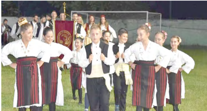
λωση Παραδοσιακής Παραγωγής Τσίπουρο Αγίας Βαρβάρας , στην πλατεία της Αγίας Βαρβάρας....