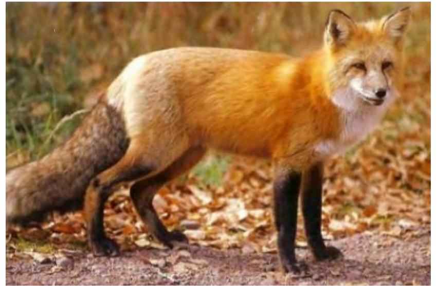
Από το Τμήμα Υγείας Ζώων και Κτηνιατρικής Αντίληψης, Φαρμάκων και Εφαρμογών της Διεύθυνσης Κτηνιατρικής της Περιφέρειας Κεντρικής Μακεδονίας ανακοινώνεται ότι παρατείνεται η συλλογή δειγμάτων θανατωμένων κόκκινων αλεπούδων έως τις 31 Μαρτίου 2019 σε όλες τις Περιφερειακές Ενότητες της Περιφέρειας Κεντρικής Μακεδονίας, στο πλαίσιο της αξιολόγησης της εφαρμογής του προγράμματος της ενεργητικής επιτήρησης της λύσσας, με σκοπό τον έλεγχο της αποτελεσματικότητας του εμβολιασμού και της επιτυχούς ανοσοποίησης των ζώων-στόχων.

Υπενθυμίζουμε ότι ο ελάχιστος αριθμός αλεπούδων ανά Περιφερειακή Ενότητα που πρέπει να εξετασθούν είναι: