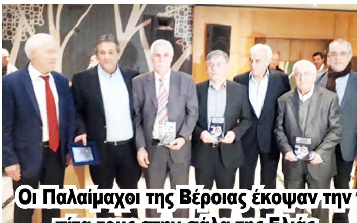
Οι Παλαιμάχοι της Βέροιας έκοψαν την πίτα τους στην σάλα της Ελιάς