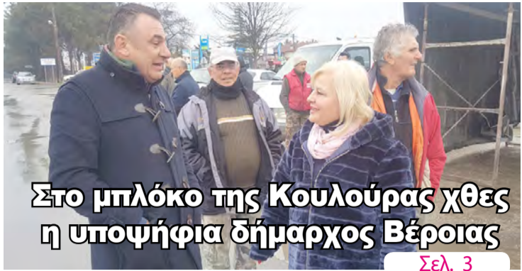
Στο μπλόκο της Κουλούρας χθες η υποψήφια δήμαρχος Βέροιας