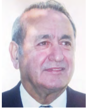
Του Παύλου Δ. Πυρινού

Ο Ιωάννης Μαλακούσης γεννήθηκε την πρώτη ή δεύτερη δεκαετία του 19ου αιώνα και πέθανε στις 21-2-1895. Έχουμε λίγες βιογραφικές πληροφορίες γι' αυτόν από την εκδιδόμενη βιβλιογραφία. Ασχολείτο με τη γεωργία και το εμπόριο. Ήταν κάτοχος των τσιφλικιών (Μυλωβιού, Μπρανιάτας και Χολυβά). Άνθρωπος απλός και σεμνός. Έμπλεος χριστιανικών αρε-