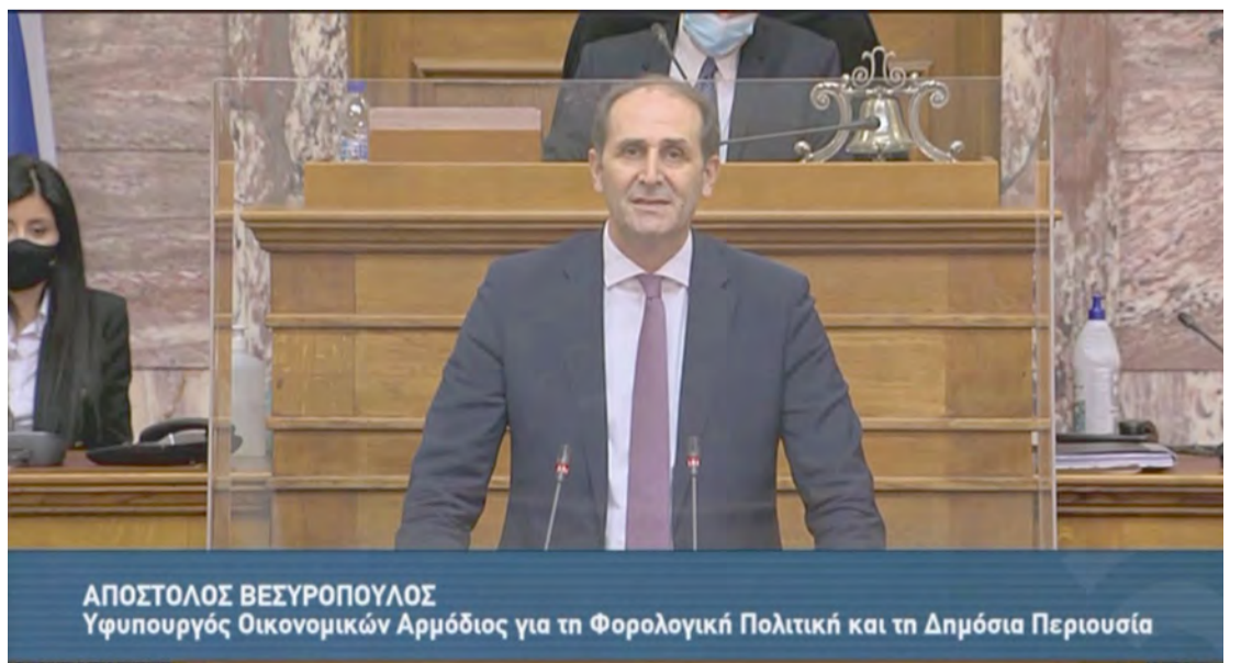
ΑΠΟΣΤΟΛΟΣ ΒΕΣΥΡΟΠΟΥΛΟΣ Υφυπουργός Οικονομικών Αρμόδιος για τη Φορολογική Πολιτική και τη Δημόσια Περιουσία

Την επόμενη μέρα, μετά την πανδημία, θέλουμε έναν ισχυρό και ανταγωνιστικό πρωτογενή τομέα.”