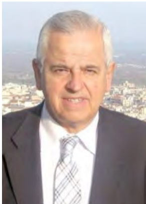
Του Τάσου Βασιιάδη

Με την έντονη μετεκλογική επικαιρότητα που μονοπώλησε το ενδιαφέρον της κοινής γνώμης, είχε ως αποτέλεσμα να περάσει σχετικά υποτονικά η «Παγκόσμια Ημέρα κατά των Ναρκωτικών και της Παράνομης Διακίνησης τους», που καθιερώθηκε από την Γενική Συνέλευση του ΟΗΕ, να τιμάται τις 26 Ιουνίου.