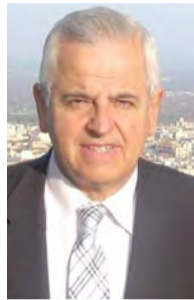
Γράφει ο ΑΝΑΣΤΑΣΙΟΣ ΒΑΣΙΛΙΔΗΣ

Το συνεχώς διαμορφούμενο γαιοπολιτικό περιβάλλον, όπως αυτό εξελίσσεται στην τρέχουσα επικαιρότητα, καθιστά εξαιρετικά επίκαιρα τα μηνύματα του εορτασμού της 28ης Ο-